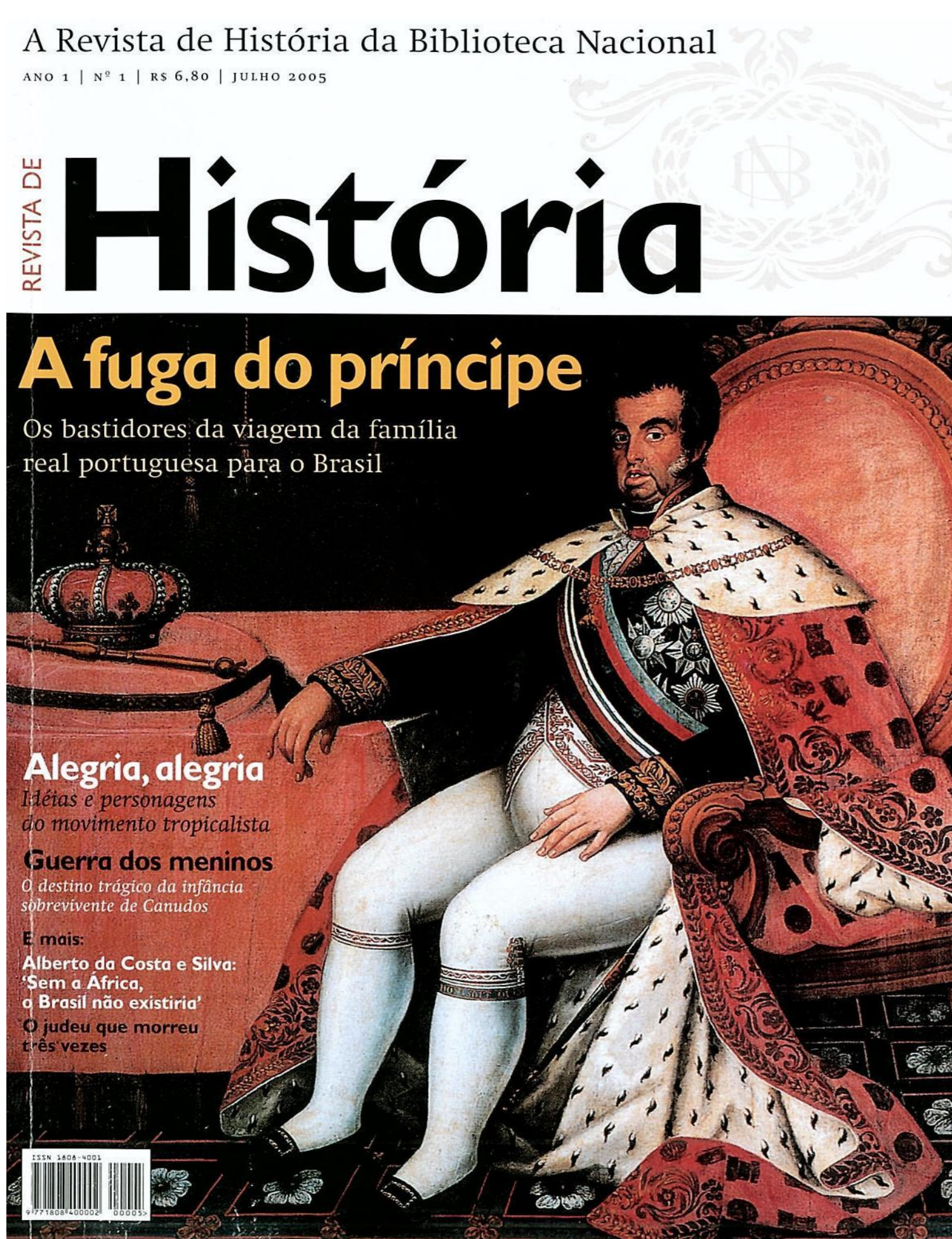
Figura 1: Revista de História da Biblioteca Nacional, Ano I, nº 1, julho de 2005

A pesquisa buscou analisar os títulos das capas da Revista de História da Biblioteca Nacional (RHBN) de 2005 a 2011, referentes às capas de nº 1 a 69, considerando as suas principais temáticas, de acordo com o mapeamento da periodização e tema de cada título, levando em consideração o perfil da RHBN enquanto meio de comunicação que constitui uma cultura histórica.